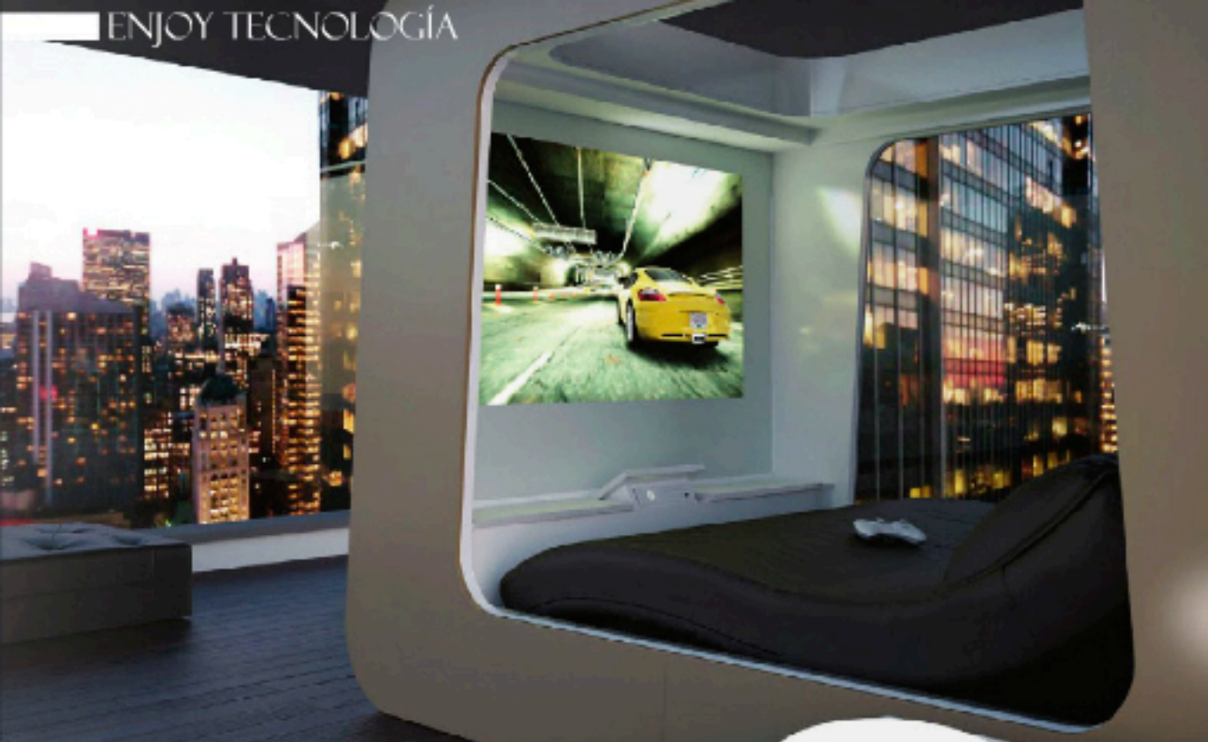
Por Cristina Larraga / Авт.: Кристина Ларрага Foto / Фотографии: www.hi-can.com