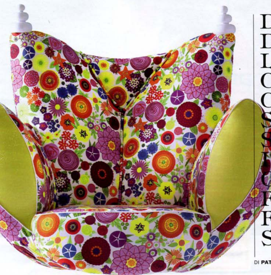
Girotondo tra i fiori SOPRA, LA PRIMAVERA SBOCCIA SULLA POLTRONA "BABOLI" IN LEGNO E TESSUTO FIRMATO KEN SCOTT, DI ALTAMODA ITALIA . QUI, A DESTRA, "SPUN CHAIR" È LA SEDUTA IN POLIETILENE CHE GIRA COME UNA TROTTOLA, DI THOMAS HEATHERRICK PER MAGIS .