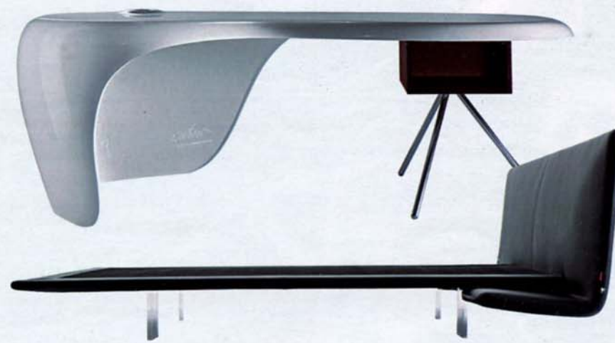
In assenza di gravità SOPRA, DALL'ALTO, L'UFFICIO DEL FUTURO? AVRÀ TUTTO SOTTO CONTROLLO DALLA SCRIVANIA ULTRALEGGERA "UNO", UN GUSCIO IN POLIURETANO LUCIDO, PROGETTATO DA KARIM RASHID PER DELLA ROVERE . SEMBRA SOSPESA NEL VUOTO LA CHAISE LONGUE "FILO", IN PELLE NERA E PIEDINI IN METACRILATO TRASPARENTE, DI PIANCA . SOTTO, FORMA ORGANICA E RIVESTIMENTO OPTICAL PER "POLTRO"; LA SEDUTA DEL DANESE MATHIAS BENGTSOON . IN SCENA AL MINDCRAFT, RASSEGNA DI GIOVANI TALENTI NORDICI, AL FUORISALONE DI ZONA TORTONA.