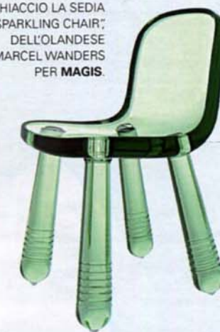
Trasparenze SEMBRA SCOLPITA IN UN BLOCCO DI GHIACCIO LA SEDIA "SPARKLING CHAIR", DELL'OLANDESE MARCEL WANDERS PER MAGIS .