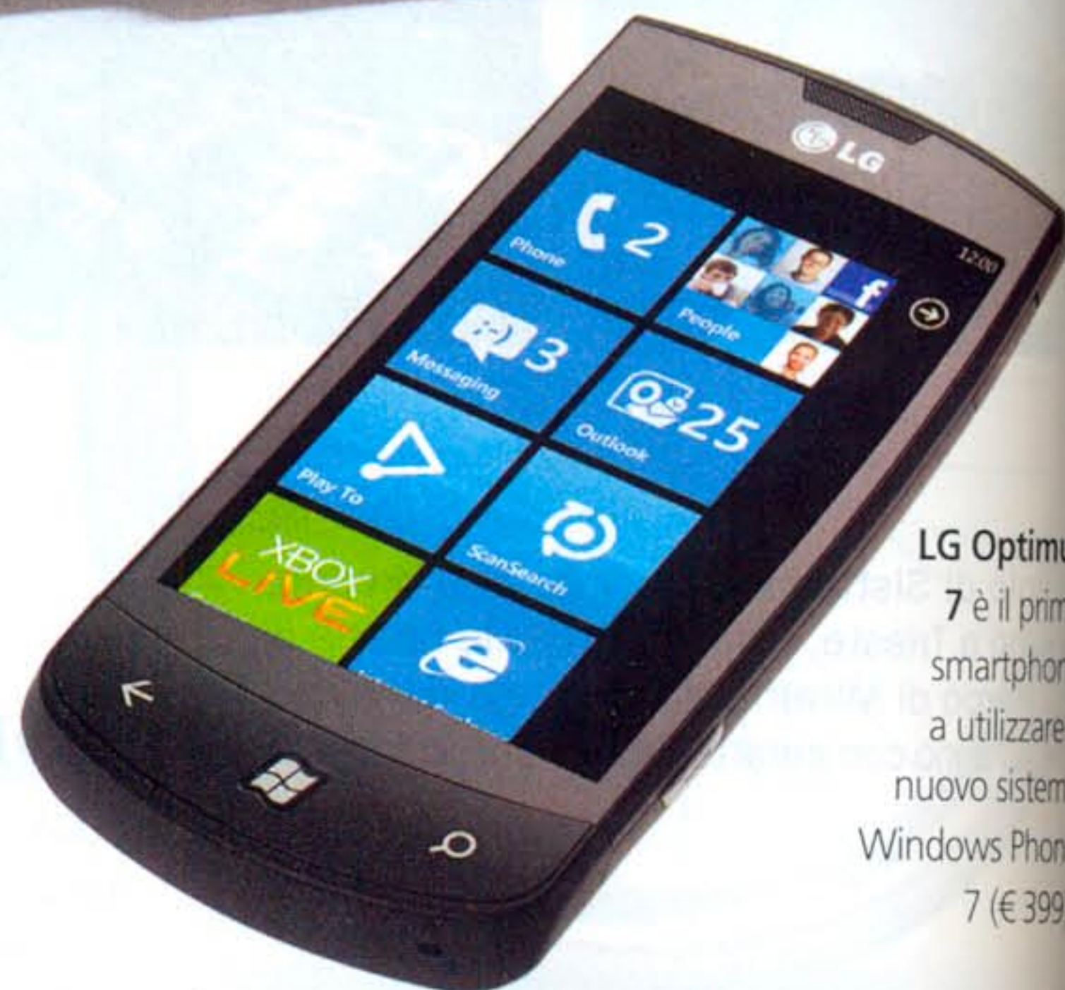
LG Optimus 7 è il primo smartphone a utilizzare il nuovo sistema Windows Phone 7 (€ 399).