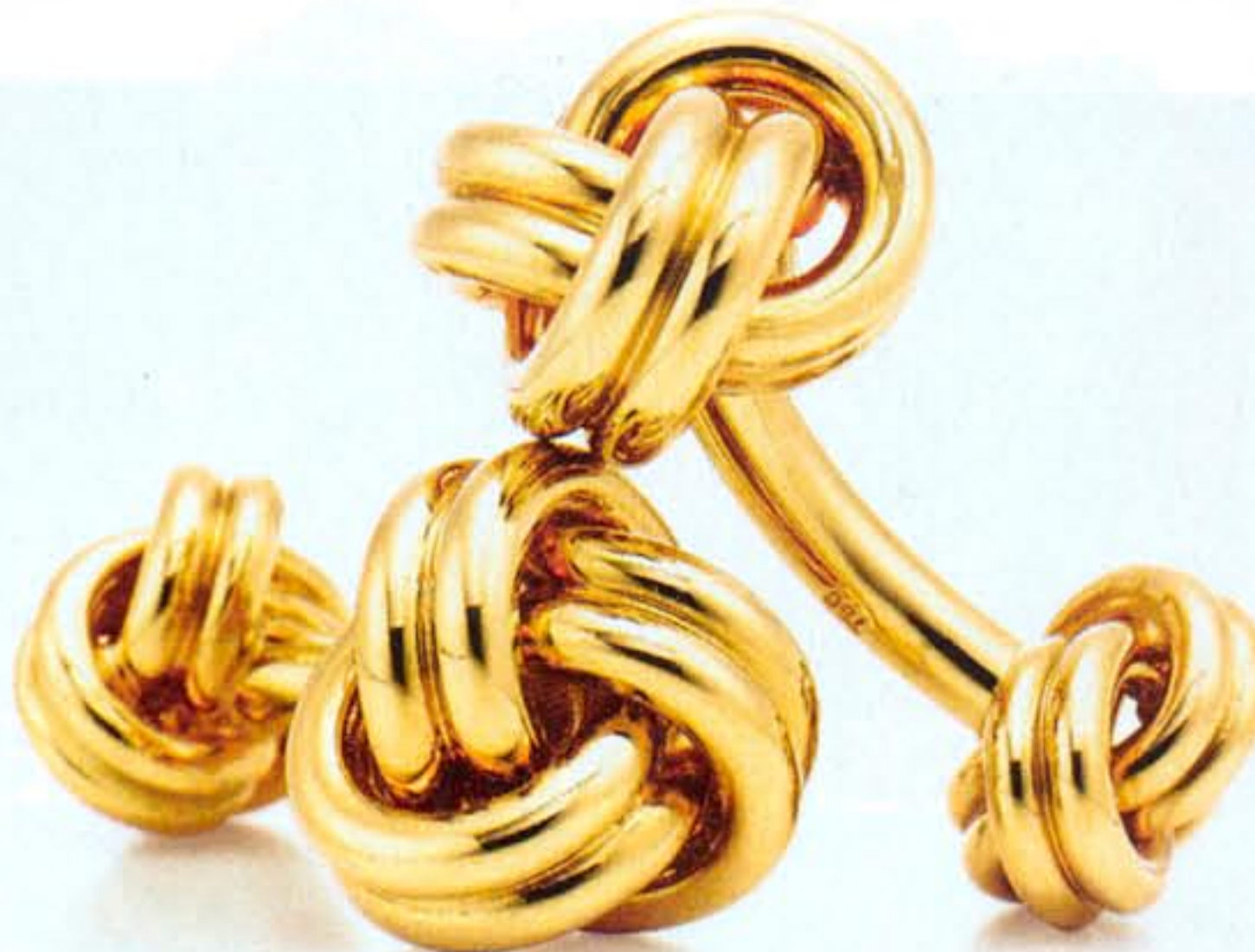
Knot cufflinks, gemelli d'oro giallo, Tiffany & Co. (€ 1.815).