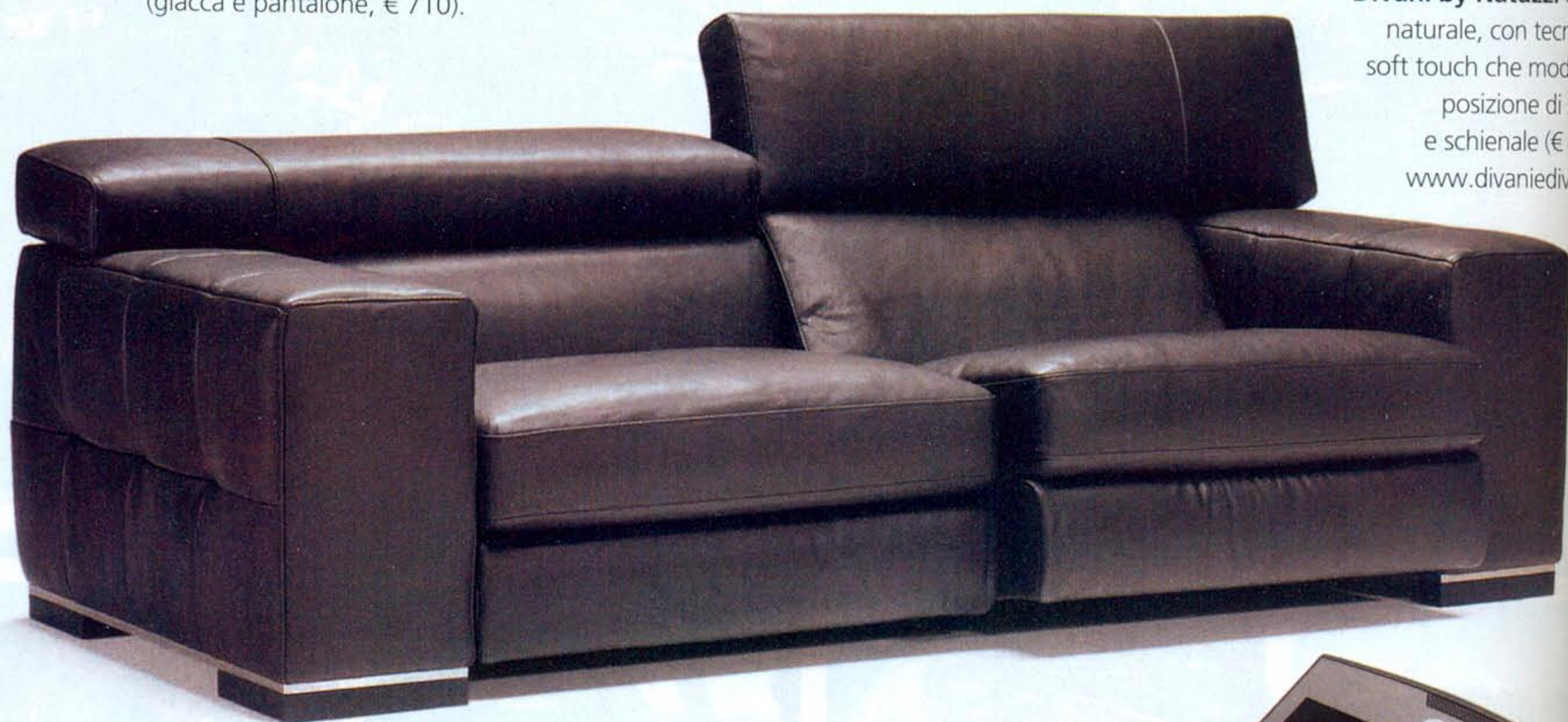
Nicolaus di Divani Divani by Natuzzi di pe naturale, con tecnolog soft touch che modifica posizione di sedu e schienale (€ 4.93 www.divaniedivani.it