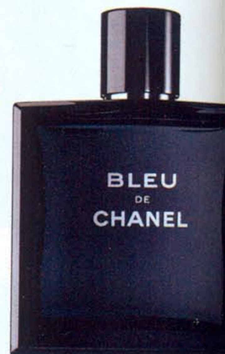
Bleu de Chanel nell'edizione da 50 ml. c vaporizzatore (€ 5