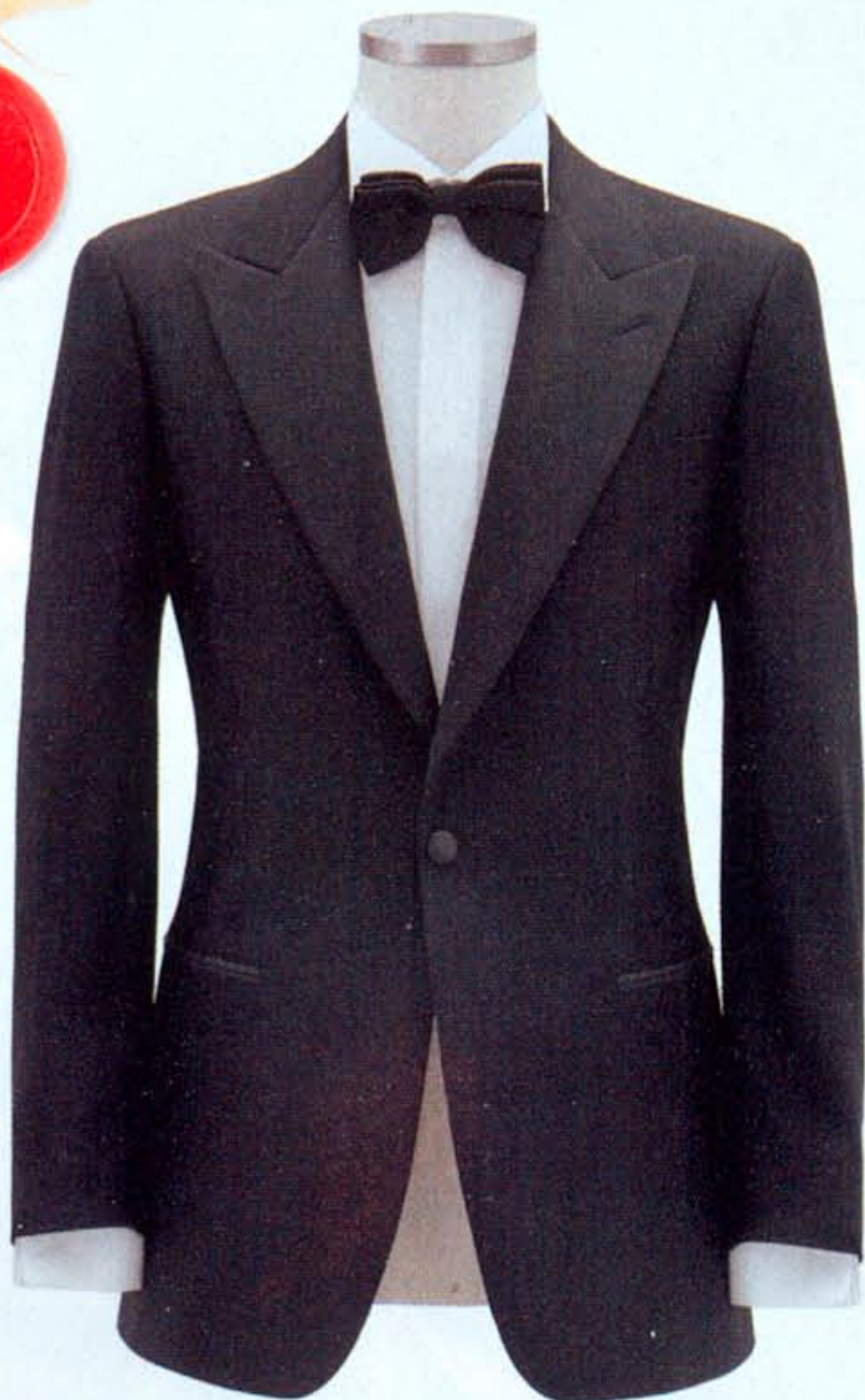
Lo smoking sartoriale Lubiam 1911 Cerimonia (giacca e pantalone, € 710).