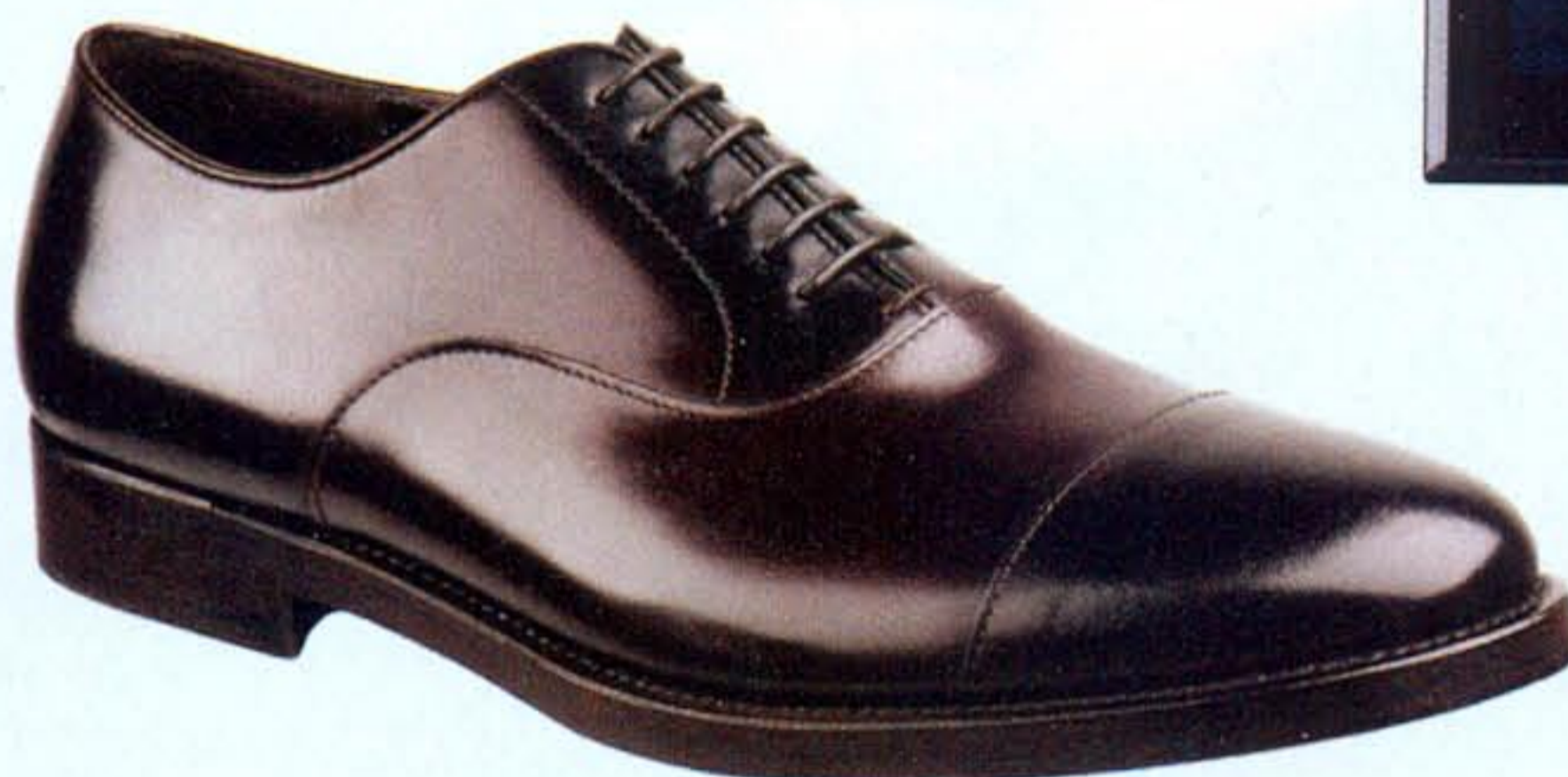
Francesina di vitello stringata Fratelli Rossetti (€ 340).